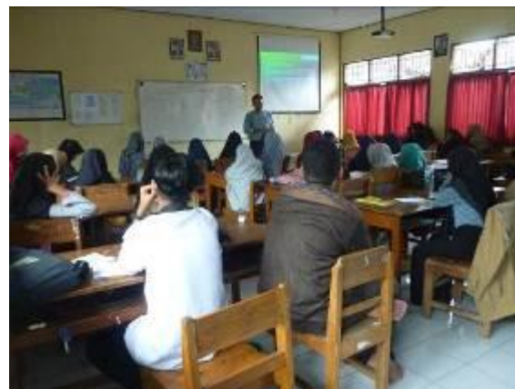
Gambar 2 dokumentasi 1, kegiatan sosialisasi dan pelatihan

Dengan pengelolaan sampah disekeliling kita, dalam hal ini adalah lingkungan sekolah MAN Karangasem, setidaknya ingin berkontribusi untuk dapat mengurangi emisi gas rumah kaca. Berawal dari sekolah, kemudian dikembangkan dilingkungan sekitar, dan dirumah masing-masing, maka hal tersebut akan menjadi kegiatan yang positif dan membuat lingkungan di sekitar kita menjadi lebih sehat. Sampah-sampah yang ada disekitar, kita pilah kembali. Sampah organik bisa kita manfaatkan untuk membuat kompos, dan dimanfaatkan kembali untuk alam sekitar kita. Berikut beberapa dokumentasi kegiatan sosialisasi dan pelatihan pembuatan kompos dari sampah di MAN Karangasem.