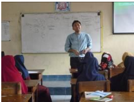
Gambar 3 dokumentasi 2, kegiatan sosialisasi dan pelatihan