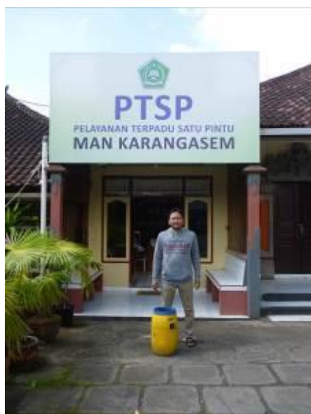
Gambar 4 dokumentasi 3, kegiatan sosialisasi dan pelatihan