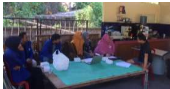
Gambar 5 Pelatihan Akuntansi

Gambar 5 menunjukkan pelaksanaan kegiatan pelatihan. Kegiatan juga dilakukan dengan memberikan form buku kas ke mitra. Mitra mengisi catatan penjualan yang telah dilakukan. Tim Pengusul memberikan beberapa form buku kas dalam binder yang dapat digunakan oleh mitra untuk melakukan pencatatan keuangan usahanya.