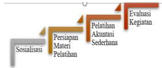
Gambar 4 Tahap Kegiatan Pengabdian

kegiatan pengabdian ditunjukkan pada Gambar 4.