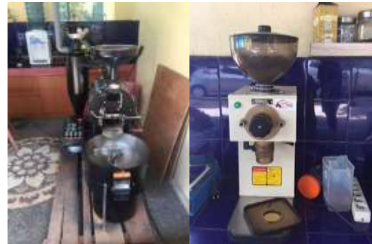
Gambar 1 Peralatan Produksi Kopi

produk mitra. Sedangkan produk grade 2 telah dikemas menggunakan bahan kertas.