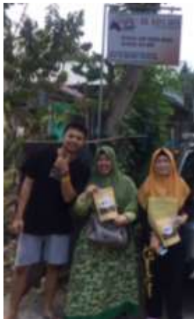
Gambar 2 Lokasi Mitra

Mitra kegiatan pengabdian ini berada di Desa Penarungan, Mengwi, Kabupaten Badung. Tim Pengusul telah mengadakan kunjungan awal untuk mengetahui keberadaan mitra, produksi yang telah dilakukan, kendala-kendala yang dialami selama mengelola usaha serta harapan atau target yang ingin dicapai untuk usahanya. Keberadaan dan lokasi mitra dapat dilihat pada Gambar 2. dan Gambar 3. Lokasi mitra dengan Kampus STIKOM Bali berjarak kurang lebih 22 km dan dapat ditempuh kurang lebih 38 – 46 menit dengan berkendara kendaraan roda empat.