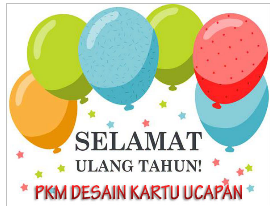
Gambar 8. Contoh Hasil Desain 2