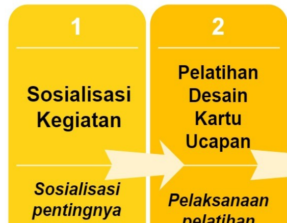
Gambar 3. Prosedur Kerja

Prosedur kerja dalam pelaksanaan kegiatan ini dapat dilihat pada Gambar 3 berikut: