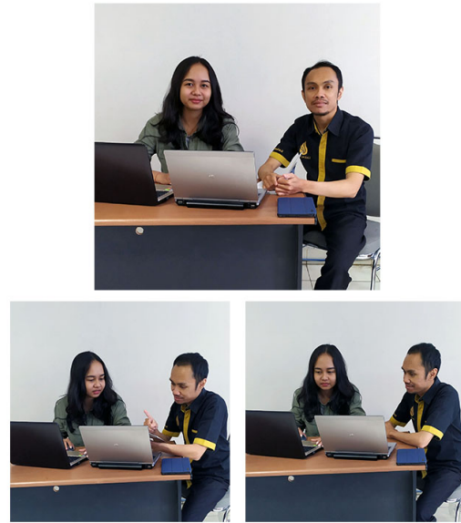
Gambar 4. Dokumentasi Kegiatan

Pelatihan desain kartu ucapan ini dibagi menjadi 2 sesi. Sesi yang pertama dilakukan pada tanggal 15 Januari 2020 sedangkan sesi yang kedua dilaksanakan pada tanggal 16 Januari 2020. Setiap sesi pelatihan berdurasi kurang lebih selama 3 jam. Pada sesi pertama ini diawali dengan latihan mencari contoh desain kartu ucapan menggunakan mesin pencari Google. Pelatih memberikan penjelasan tentang bagaimana cara menggunakan kata kunci ( keywords ) yang tepat. Beberapa keywords yang digunakan adalah: desain kartu ucapan, ucapan ulang tahun, ucapan hari ibu, valentine gift cards, dan sebagainya. Selain itu mitra juga diberikan pemahaman tentang isu copyright atau hak cipta atas suatu gambar.