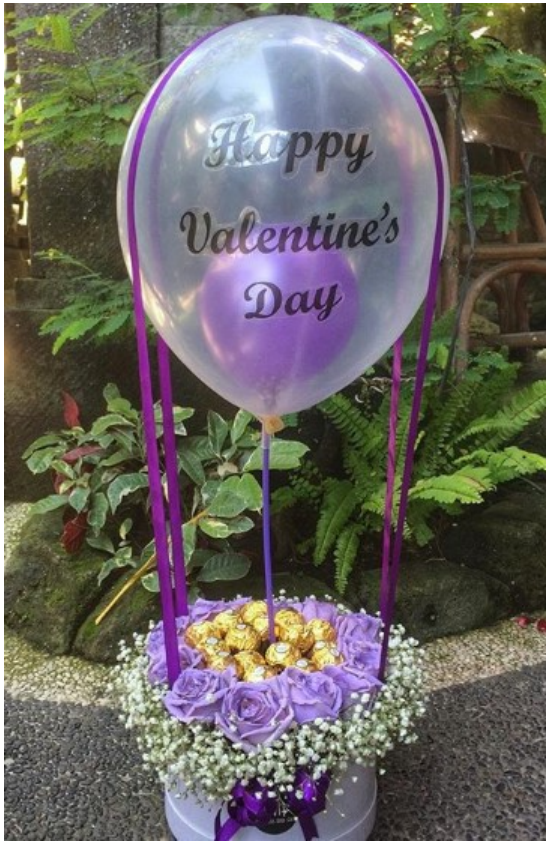
Gambar 2. Hasil Buket Bunga Mitra

Usaha florist AVA Flowers & Gift mendapatkan pasokan bahan baku bunga dari daerah di luar kota Denpasar serta dari beberapa daerah di Pulau Jawa. Selain bahan baku bunga, pernak-pernik serta hiasan untuk dekorasi bunga dibeli pada toko souvenir dan beberapa di antaranya dibuat atau diproduksi sendiri. Salah satu pernak-pernik atau pelengkap yang umumnya ada pada buket bunga yang dijual adalah kartu ucapan. Saat ini pemilik usaha selalu membeli kartu ucapan di toko-toko souvenir. Kartu ucapan tersebut umumnya sudah dalam bentuk jadi dan hanya perlu dilengkapi dengan tulisan atau kalimat ucapan yang diinginkan pelanggan. Namun demikian, adakalanya desain kartu ucapan yang telah dibeli tersebut tidak sesuai dengan keinginan dari pelanggan. Sehingga tidak