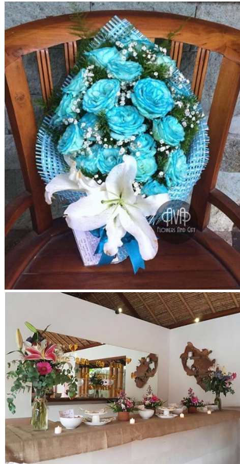
Gambar 1. Hasil Jasa Dekorasi Mitra

Omset rata-rata bulanan dari usaha florist ini mencapai Rp 2.000.000,- dan selalu meningkat pada Hari Valentine (14 Februari) dan Hari Ibu (22 Desember). Pada hari-hari tersebut banyak remaja yang memesan dan membeli bunga sebagai hadiah pemberian. Selain melayani penjualan, AVA Flowers & Gift juga melayani pemesanan bunga untuk dekorasi acara pernikahan, ulang tahun, bridal shower , serta berbagai kegiatan seremonial lainnya. Omset dekorasi untuk acara kegiatan-kegiatan tersebut mencapai Rp 2.000.000,- dalam satu acara.