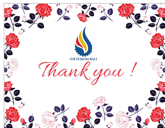
Gambar 9. Contoh Hasil Desain 3