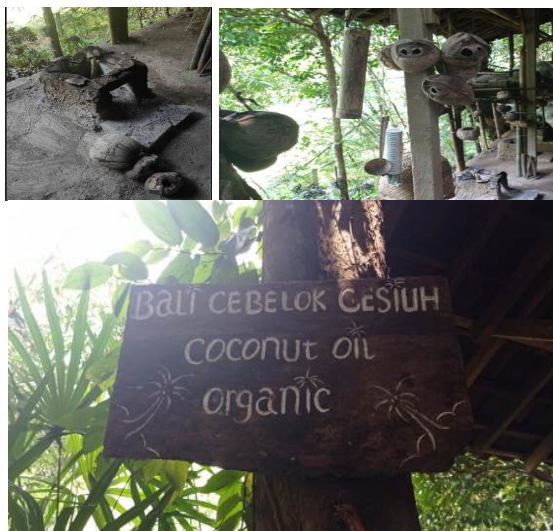
Gambar 2. UMKM Bali Cebelok Gesiuh

berkunjung dan mengikuti kursus nantinya dapat membuat VCO secara mandiri. Manfaat dari kegiatan adalah dapat meningkatkan minat wisatawan untuk belajar kursus dan membeli produk VCO di UMKM.