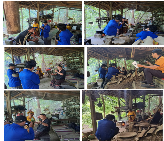
Gambar 4. Proses perekaman pembuatan VCO

yang mudah dan praktis untuk dipelajari dan diikuti oleh peserta.