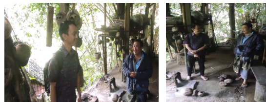
Gambar 1. Observasi ke UMKM

Chaidir et al. , 2023; Sa’diyah, Wulansari and Devianti, 2023). Namun seiring perkembangan waktu berjalan, banyak usaha sejenis tumbuh di sekitaran banjar pujung kaja. Dampaknya adalah adanya penurunan harga jual dan menyebabkan adanya persaingan pemasaran produk VCO. Berdasarkan hal tersebut, pemilik mencoba untuk mengalihkan fokus usaha dari produksi produk menjadi produksi jasa. Jasa yang dimaksud adalah beralih membuat kelas kursus dengan istilah cooking class untuk membuat VCO.