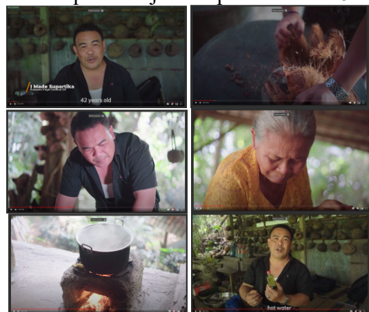
Gambar 5. Hasil Video Pembuatan VCO

Dalam kegiatan kedua, diawali dengan kegiatan persiapan pembuatan VCO. Kemudian dilakukan perekaman video pembuatan minyak VCO selama 60 menit. Kemudian dilakukan istirahat dan melakukan pengisian daya perangkat kamera dan lighting selama 30 menit. Setelah istirahat, dilakukan perekaman untuk profil pemilik usaha VCO. Hasil pembuatan video tutorial dapat diakses pada https://drive.google.com/file/d/1UfTrLFg_jIdqT56crQAIp63-g0-MSZu/view?usp=sharing dan potongan video dapat ditunjukkan pada Gambar 5.