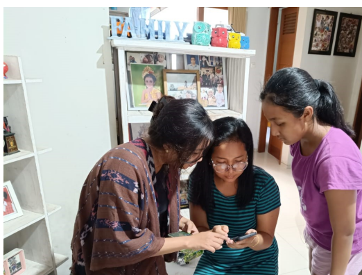
Gambar 3. Pelatihan Penggunaan Sosial Media

Pada kegiatan pengabdian yang pertama peserta belajar bagaimana cara menggunakan atau memanfaatkan sosial media instagram sebagai media promosi dapat dilihat pada gambar di bawah ini.