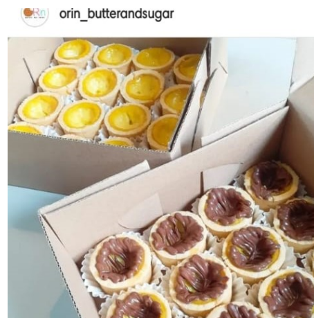
Gambar 1. Produk Unggulan Mitra

Usaha yang dilakukan oleh Mitra cukup menjanjikan karena produk yang dihasilkan sangat diminati di masyarakat, terbukti dengan banyaknya permintaan atau pesanan setiap harinya mencapai belasan toples. Produk unggulan mitra yang memiliki permintaan cukup banyak yaitu Pie dan Brownies cookies , ditunjukkan pada Gambar 1.