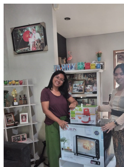
Gambar 5. Pemberian Alat Produksi Ke Mitra

Kegiatan pemberian bantuan alat produksi dilakukan pada bulan Maret 2023. Alat produksi yang diberikan berupa Mixer, Oven, dan loyang. Melalui pemberian alat-alat produksi tersebut, potensi untuk meningkatkan produksi aneka kue menjadi lebih besar. Hal ini berkontribusi pada peningkatan omzet dari penjualan produk dan memberikan berdampak positif terhadap pendapatan usaha.