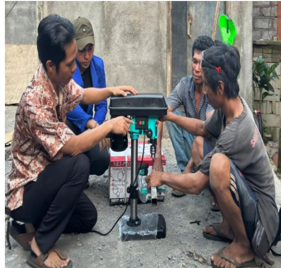
Gambar 4. Pelatihan Penggunaan Alat Produksi

tim ke mitra. Tim pengabdian juga memberikan pelatihan cara menggunakan alat produksi berdasarkan buku manual dan pelatihan yang didapat dari penjual. Berikut adalah kegiatan pelatihan penggunaan alat bor listrik.