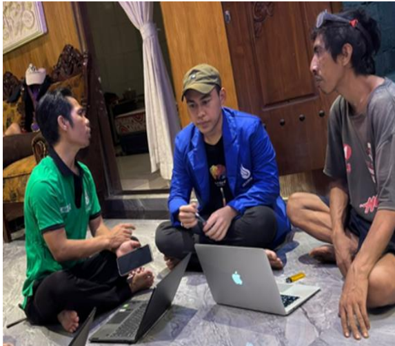
Gambar 2. Rapat tim dengan mitra

Hasil rapat tim dengan mitra untuk menentukan peralatan dan spesifikasi alat produksi, dijadikan dasar tim pengabdian untuk membeli alat produksi yang akan dihibahkan ke mitra. Proses pembelian dilakukan oleh tim toko peralatan mesin. Mesin bor besi yang telah dibeli kemudian dihibahkan ke mitra pada tanggal 18 Maret 2024 di lokasi mitra. Berikut adalah alat produksi yang dihibahkan ke mitra oleh tim pengabdian.