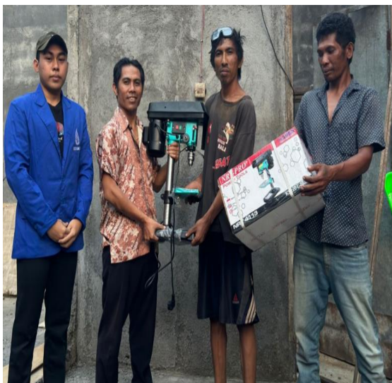
Gambar 3. Serah terima barang produksi

Hasil rapat tim dengan mitra untuk menentukan peralatan dan spesifikasi alat produksi, dijadikan dasar tim pengabdian untuk membeli alat produksi yang akan dihibahkan ke mitra. Proses pembelian dilakukan oleh tim toko peralatan mesin. Mesin bor besi yang telah dibeli kemudian dihibahkan ke mitra pada tanggal 18 Maret 2024 di lokasi mitra. Berikut adalah alat produksi yang dihibahkan ke mitra oleh tim pengabdian.