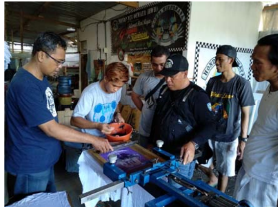
Gambar 3. Proses Sablon

3) Setelah membuat desain dan screen selanjutnya adalah melakukan proses sablon menggunakan alat meja sablon.