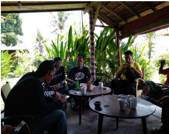
Gambar 1. Rapat Persiapan dengan Mitra

1) Kegiatan pertama yang dilakukan adalah bertemu dengan mitra dan menjelaskan program kerja yang akan dilakukan seperti gambar 1, yang merupakan photo rapat persiapan dengan mitra.