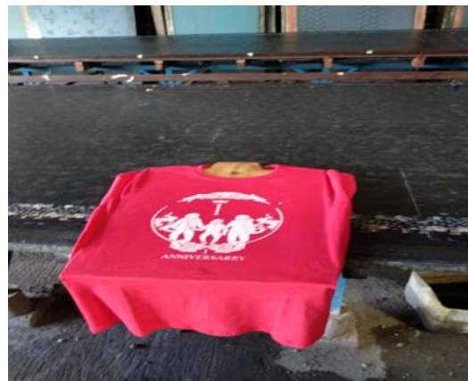
Gambar 4. Pengeringan Hasil Sablon

4) Tahap terakhir adalah pengeringan hasil sablon.