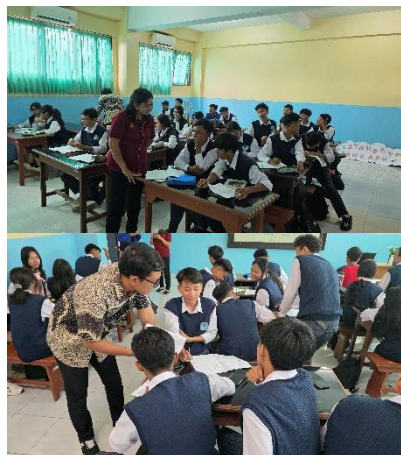
Gambar 1. Dokumentasi Kegiatan Pengabdian di SMK DWIJENDRA Denpasar

kritis, berdiskusi, serta mengembangkan ide secara terstruktur. Pendekatan berbasis tugas memungkinkan siswa tidak hanya menerima materi secara teoritis, tetapi juga secara langsung mempraktikkan penggunaan Bahasa Inggris dalam kegiatan menulis.