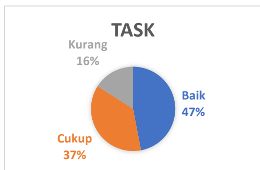
Gambar 3. Diagram Hasil Perhitungan Task

dan 30 siswa (50%) berada pada kategori kurang. Data ini menunjukkan bahwa sebelum pelatihan dilaksanakan, mayoritas siswa masih mengalami kesulitan dalam menulis paragraf argumentasi Bahasa Inggris, terutama dalam aspek pengorganisasian ide, penggunaan tata bahasa, serta pemilihan kosakata yang tepat.